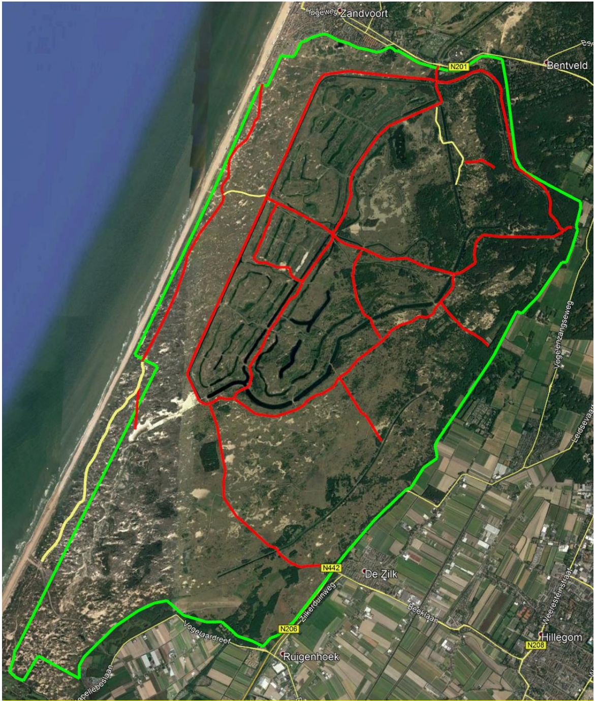
Amsterdamse Waterleidingduinen, verharde paden